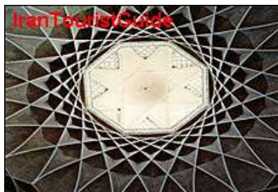
شکل شماره ۳-۲: یک اثر معماری