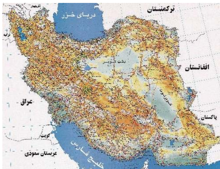
شکل شماره ۳-۳: نمونه نقشه ایران

باید تا حد امکان از به‌کاربردن صفحه‌های بزرگ مانند نقشه‌ها در پایان‌نامه خودداری شود و آنها را از طریق رونوشت‌های (فتوکپی‌های) مخصوص در اندازه تعیین شده تهیه کرد. در صورت لزوم باید به دقت صفحه مورد نظر را داخل پایان‌نامه طوری تا نمود که لبه آن از دیگر صفحه‌ها بیرون نزند. نقشه نوعی شکل است و باید در ادامه شکلها شماره‌گذاری شود.